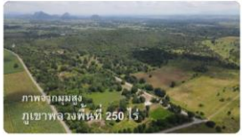
โครงการค่ายคุณธรรม... กว่า 1,043 คน · 3 วิดีโอ

มหาวิทยาลัยราชภัฏพระนคร @pnuofficial903714 · ผู้ติดตาม 2,955 คน · วิดีโอ 128 รายการ มหาวิทยาลัยราชภัฏพระนครมีจุดเด่นที่เป็นที่ภาคภูมิใจและเป็นเลิศ โดยกระบวนการจัดการเรียนการสอน... ติดตาม